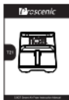
Kasutusjuhend x 1