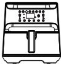
Kvaliteetne 5,5-liitrine kuumaõhufritüür T21 *1