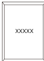
Retseptiraamat x 1