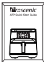
Kiirjuhend x 1